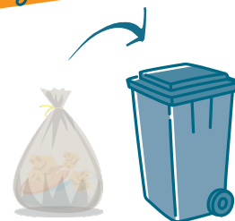
SAC TRANSPARENT DANS LE BAC ROULANT